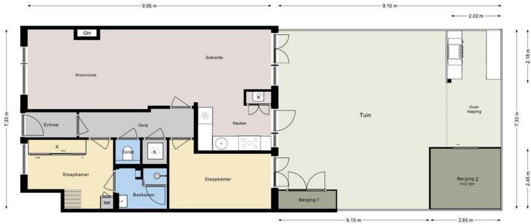
OUDE BOOMGAARDSTRAAT 29 Perceel