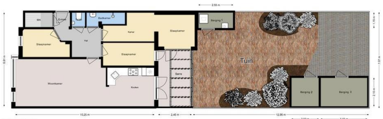
VLIERBOOMSTRAAT 307 Perceel